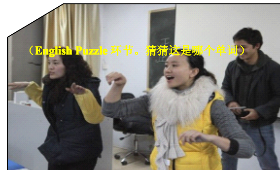
(English Puzzle 环节，猜猜这是哪个单词)

了英语话剧汇演的环节。各学员分成小组在培训师的指导下排演出话剧节目，于2月15日晚进行了汇演。许多节目幽默诙谐，富有创意，语言流畅、表演特色，令大家刮目相看。