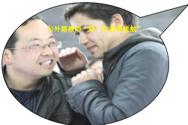
与外籍教师“第一次亲密接触”

2月7日，第二次甘肃省成县英语教师培训在陇南市农业技术学校举行。共有128名教师参与了此次培训。