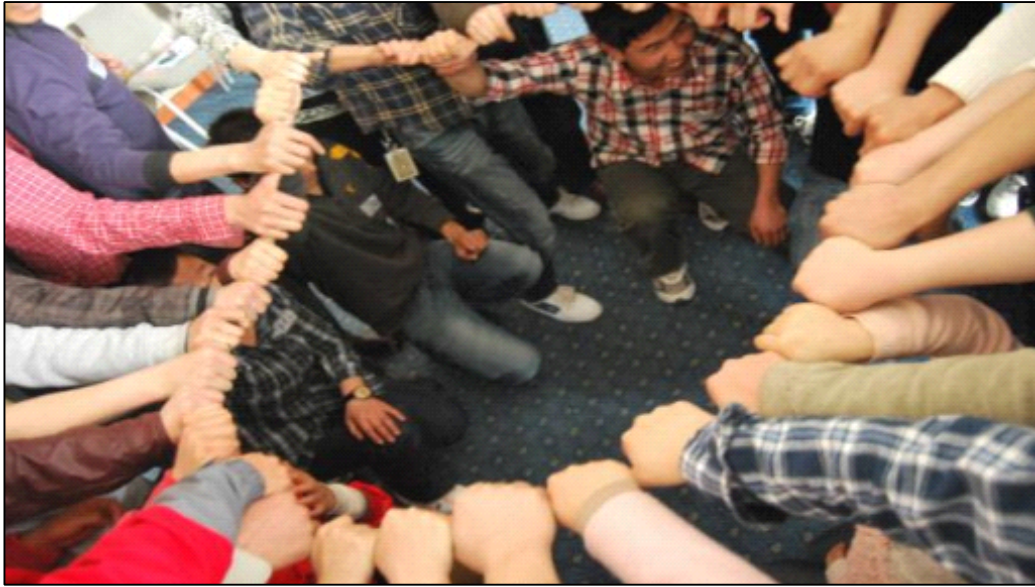
（我们在一起，相互给力）