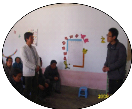
（基金会工作人员在做现场培训）