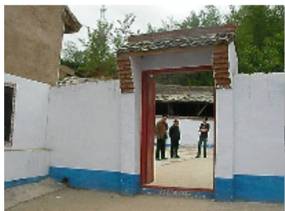
南阳童趣园改造前后