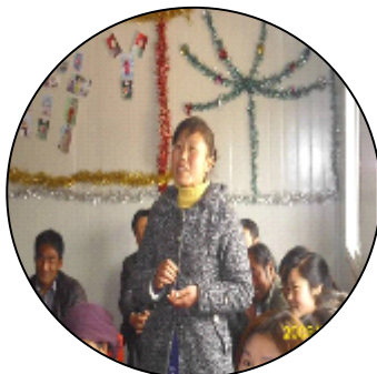
（家长在培训现场发言、记录）