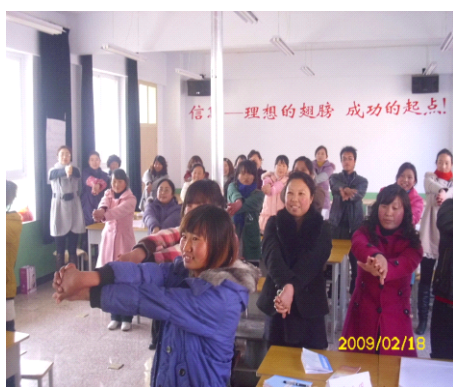
（学员们开心的热身活动）

培训以理论学习与实践经验、参与讨论与小组分享、提问与反馈相结合的方式，着重讲解了在农村幼儿园现有的条件下，怎样在教育教学中通过利用本地教育资源、创设适宜的教育环境，开展多种游戏活动，以促进幼儿“全人”发展。两位老师长期开展各类幼儿教师培训，经验丰富、讲解深入浅出，培训得到了学员们的欢迎和肯定。