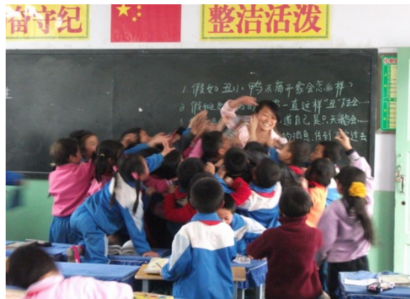
(孩子们毫不掩饰对参赛教师的喜欢)

为期 8 天的初赛共有近 1000 名教师参加，从中产生了 350 名教师进入复赛。4 天的复赛分三个赛场，共有 55 名评委（由教学管理人员、一线教师担任）参与评选活动。本次活动是宕昌县有史以来参与教师人数最多、参与学科最多、评委最广泛的一次历史性突破，各方都给予高度的评价。活动结束后，宕昌县教育局组织评委分组召开总结会，总结这次竞赛的成功与不足，探讨宕昌县小学教育教师能力提升的相关问题。