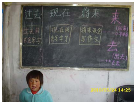
(当地大多幼儿园的课以识字为主)