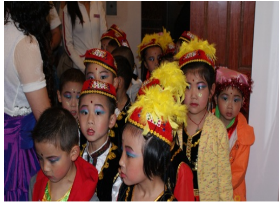
（马上就要上场了，有点紧张）