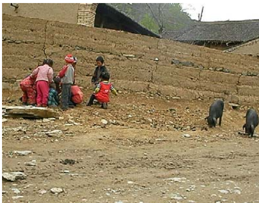
(这，就是当地孩子们的“幼儿园”)