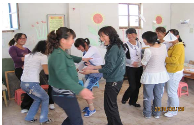
(幼儿教师培训现场)

甘肃靖远县项目示范园现场教师培训 5月底，项目人员在靖远县组织项目园教师开展了游戏活动现场培训。活动现场幼儿园教师积极参与，表现活跃，她们都表示很有收获。6月底，项目人员与各园教师就下半年工作进行初步规划，还就暑假组织示范园教师下一步培训的相关事宜进行了沟通。