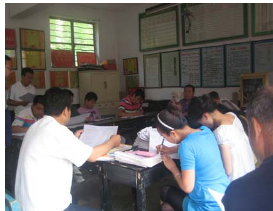
（教师们正在认真地填写调研问卷）