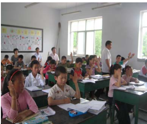
（调研人员在课堂上听课、录课）

通过调研了解到，成县的教育发展、质量提升仍有大量问题有待解决和改善。许多老师希望组织一些比较实用并切合实际的教师培训，着力改善课堂教学质量。在培训方式上，老师们提出了以下几点意见：多观摩一些优质课、专家说课评课、培训师现场答疑、分组分层次的学科专业培训、外出参观学习交流等。在培训内容方面，老师们更希望了解如何有效分析教材及把握教学重点、如何更好的管理班级和与学生沟通、如何提高复式教学的课堂有效性、如何提高校本教研的质量及集体备课的有效性、教师如何应对工作压力以及正确处理寄宿生的心理问题等。