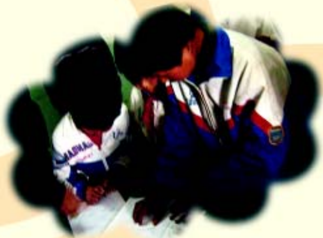
上海新联康投资顾问有限公司 资助的孩子领取资助金

经过各方努力，2007年受助学生达300多人，主要帮助学生的杂费和生活费，资助金额约185700元。受助老师达186人，资助金额1629000元，总资助金额348600元。