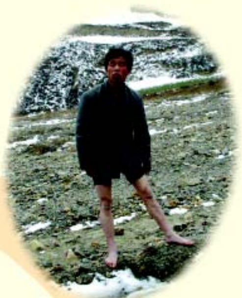
受渣打银行资助的甘肃省宕昌县代课教师