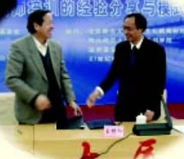
与美国海外志愿服务社(VSO)建立战略合作伙伴关系