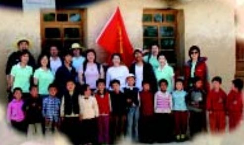
财富人生五一西部行合影