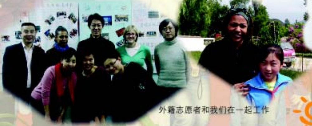
外籍志愿者和我们一起工作