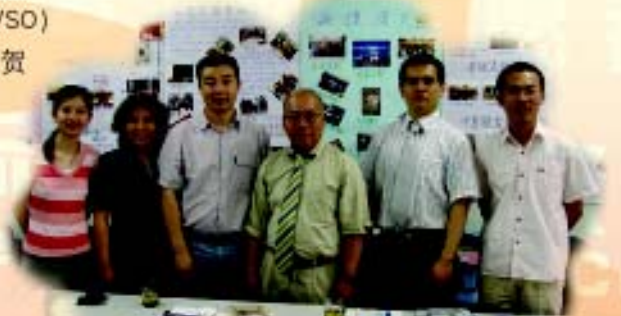
与日本北海道大学的教授交流合影