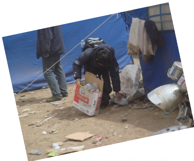
【志愿者带头在灾民聚居地捡垃圾】

突发灾难，大批人聚集，没有厕所和垃圾回收站，灾民聚居地垃圾和粪便随处可见，矿泉水瓶遍地乱扔，环境卫生极其糟糕，灾民生活质量直接受到影响。4月19日，西部阳光基金会工作人员和山水自然保护中心、天下溪教育中心等公益组织的志愿者紧急协商，迅速行动起来，动员了100多名当地群众共同参与，“因地制宜”，寻找能用的材料，在一天的时间里为灾民聚居地搭建了二十几个垃圾站和简易厕所，有效地改善了当地的卫生情况。随后，垃圾站建设受到当地政府很大重视，更多的垃圾站陆续搭建。