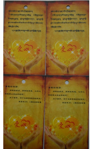
【祝福礼品所附卡片内容】