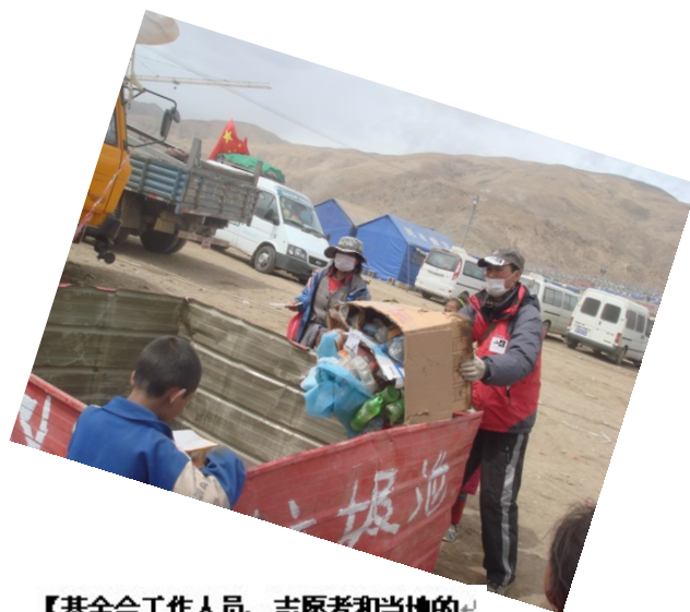
【基金会工作人员、志愿者和当地的孩子一起参与到清理垃圾的过程中】