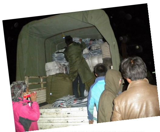
【深夜打着手电筒分装救灾物资】